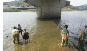
都田川でヤマトシジミ採り。佐鳴湖での産卵観察へ。少し夕食でも頂きました。