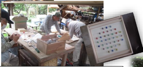
毎週火曜日は自然素材で物づくりの日。ボードゲームが人気、ちょっとしたブームになりました。