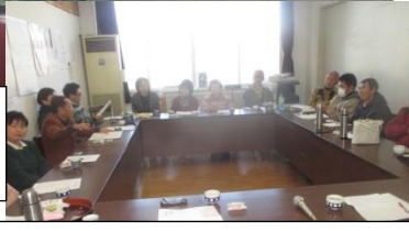
ツアー後の総会には、東北より伝統の茅葺職人の社長さんも同席されました。