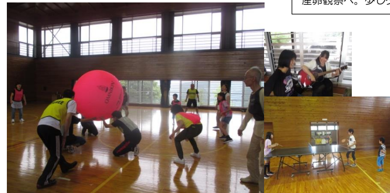
山里の体育館を借り切り好きな時間を楽しみました～。みんなのびのびしていました。