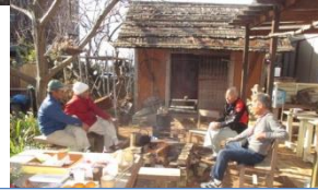
焚火を囲んで、新年明けましておめでとうございます。ゆったり流れる時間でした～。