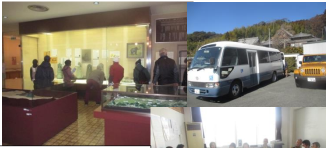
バスで行く縄文弥生古代ロマンツアー好評でした！